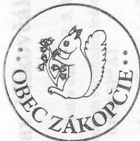
pečiatka a podpis

ARCHEKTA, s.r.o. spoločnosť pre architektúru, konštrukcie a statiku