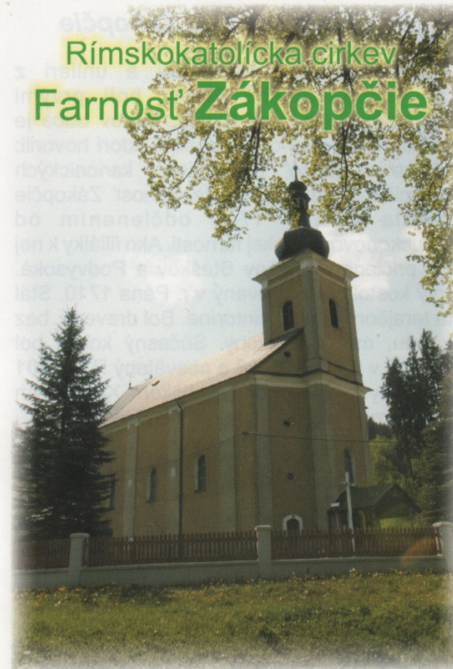
farský kostol sv. Jána Krstiteľa